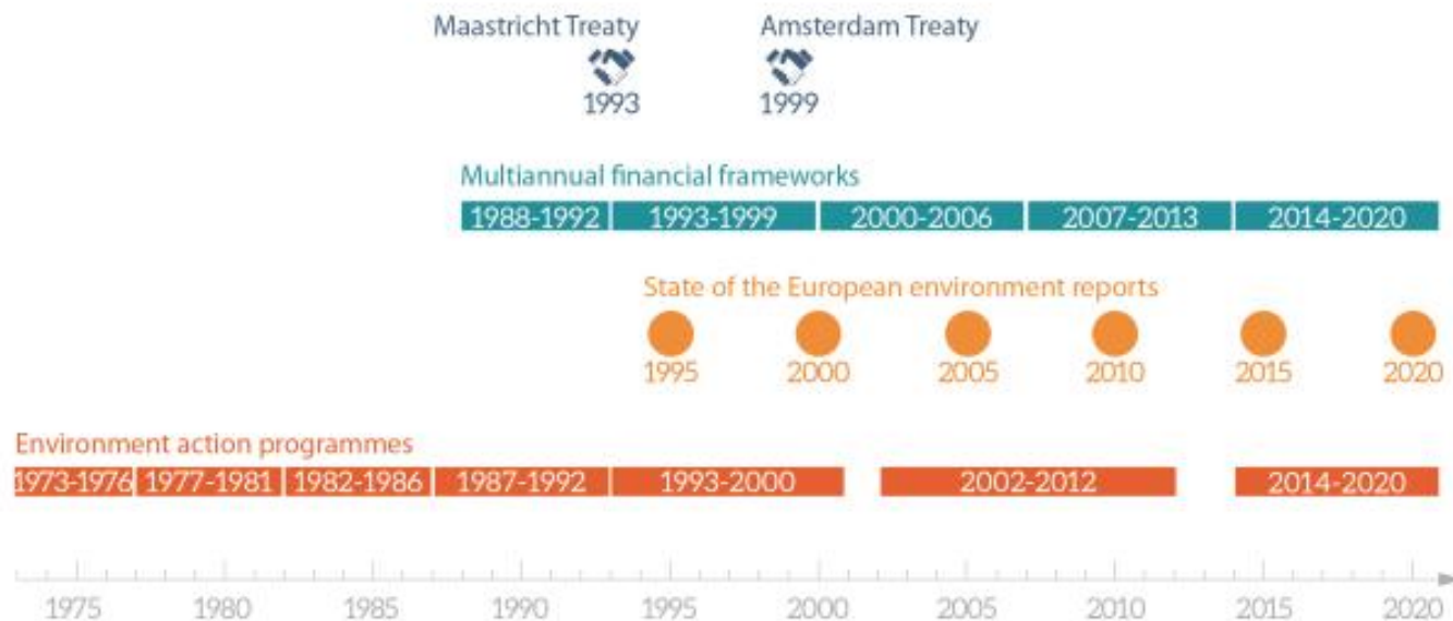
Figure 1 – Timeline of environment action programmes and other relevant aspects

Na obrázku dole můžeš vidět časovou osu předchozích Akčních programů pro životní prostředí.